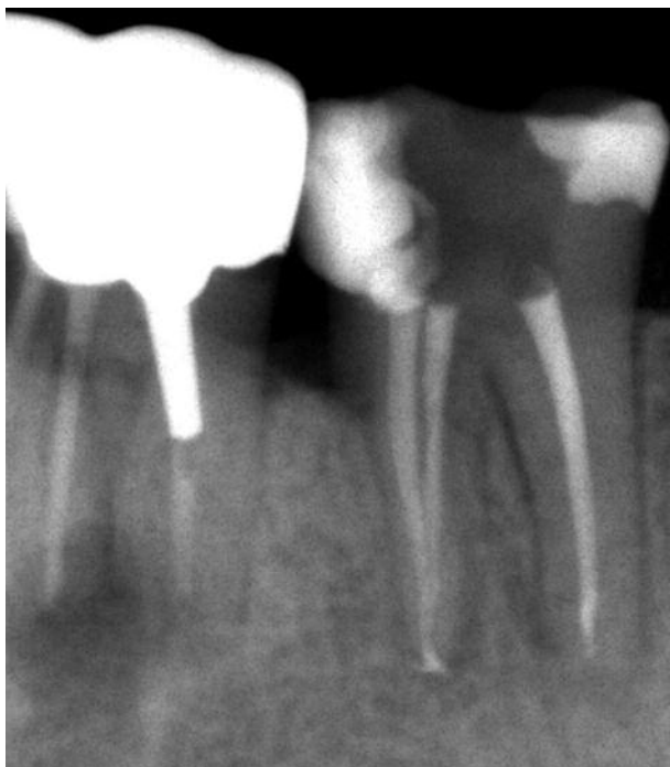
Abb. 13: Die Röntgenkontrollaufnahme.