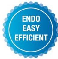
Abb. 2: VDW Claim